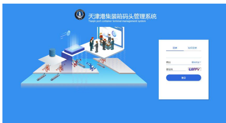
图 1 登录界面

用户在浏览器中输入网址 https://bil.tjgportnet.com 后单击登录按钮跳转到登录窗口如图 1 所示：