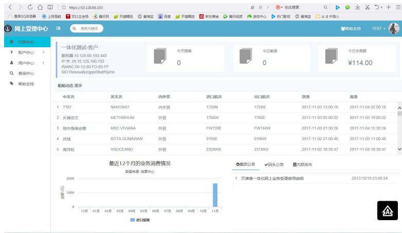
图 2 网上受理中心主界面