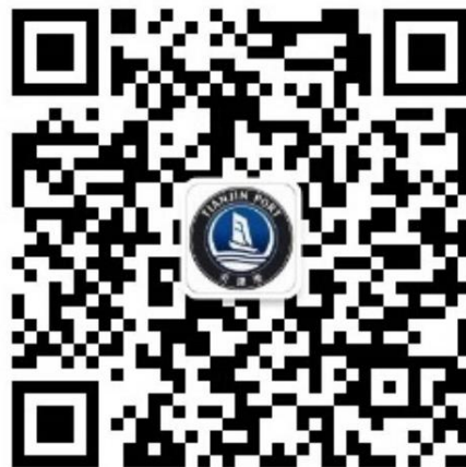
电子商务网微信服务号二维码